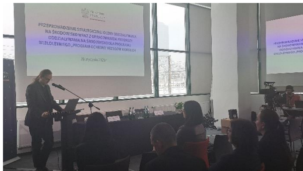
Rysunek 4. Zdjęcia Sali konferencyjnej

Stacjonarnie w wydarzeniu wzięli udział przedstawiciele administracji rządowej (Zamawiającego), morskiej, organizacji pozarządowych oraz konsultanci odpowiedzialni za przygotowanie prognozy.