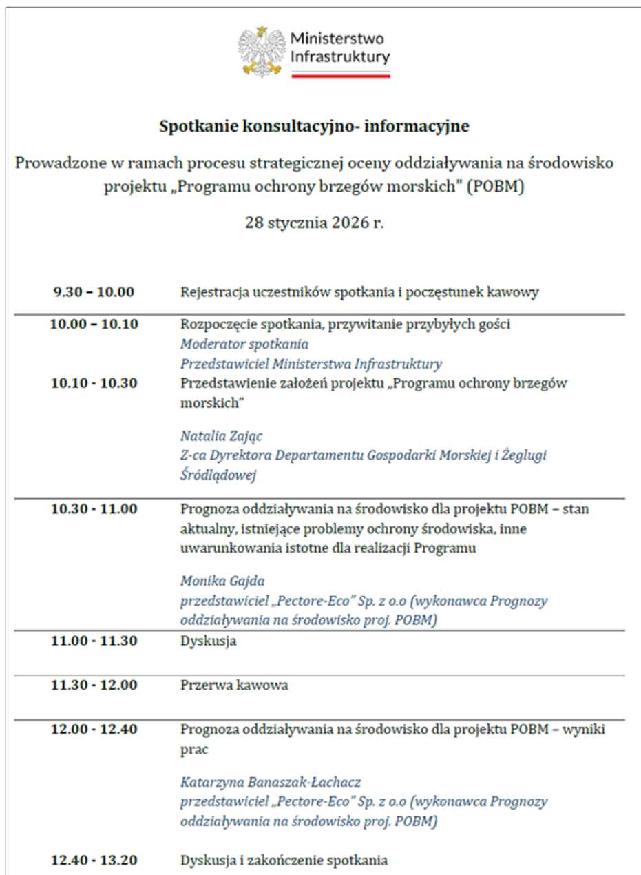
Rysunek 1. Agenda spotkania

W ramach organizacji spotkania trzykrotnie rozesłano zaproszenia mailowe z informacją o wydarzeniu i linkiem do formularza rejestracji. Wysyłki zaproszeń dokonano do ustalonej listy interesariuszy, około 100 podmiotów, w tym m.in. do jednostek administracji rządowej, administracji morskiej, wybranych jednostek Państwowego Gospodarstwa Wodnego Wody Polskie, parków narodowych i krajobrazowych, Narodowego Funduszu Ochrony Środowiska i