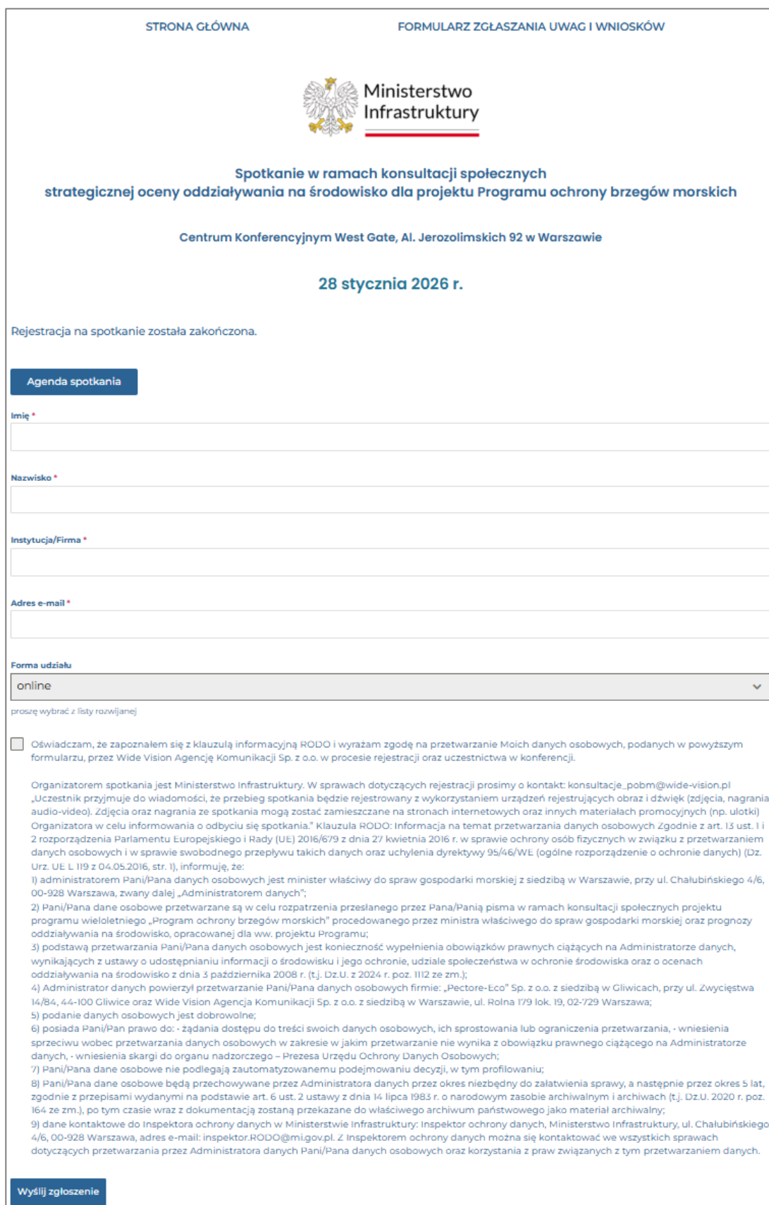
Rysunek 3. Widok formularza rejestracji na spotkanie